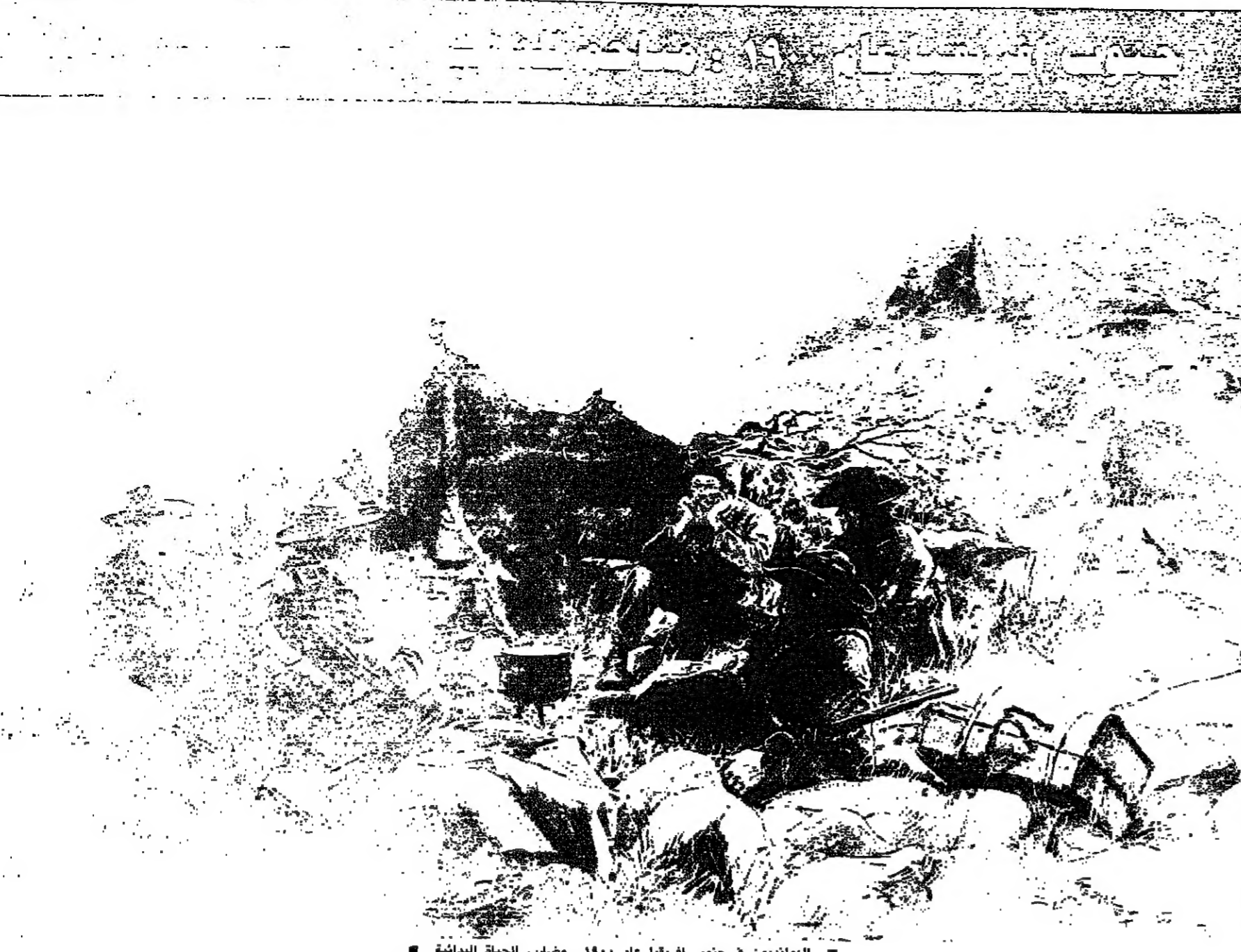
الهولنديون في جنوب افريقيا عام ١٩٠٠ مضارب الحياة البدائية